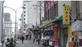
「再来宴」という中華料理屋さんの看板が見えます。