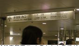
「新宿駅西口」と書かれた看板が見えます。