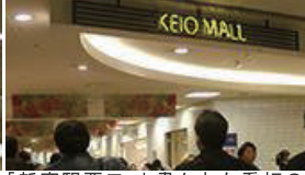
「新宿駅西口」と書かれた看板の矢印の方角に進むと「KEIO MALL」と書かれた電飾看板のある、ショッピングモールがあります。