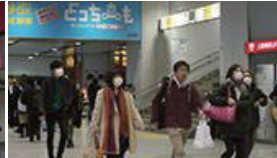
改札を出ると右手に階段が見えます。