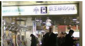
壁つたいに進むと、京王線のりばが見えてきます。