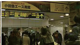
さらに進んでいくとショッピングモールを抜けます。その後、右手の壁つたいに進んでいきます。