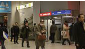
切符売り場を正面に見て、左手の方に、階段が見えます。