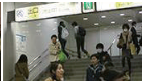
階段を上り、「出口」と書かれた方向へ上ります。