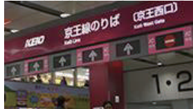
京王線新宿駅京王西口改札を出ます。