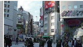
靖国通りの交差点に出ます。信号名「新宿大ガード西」を真っ直ぐ渡って停止。左を向いて、また信号を渡ります。