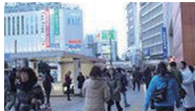
地上出口に向かって右方向に約200m道なりに進みます。