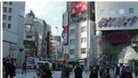
靖国通りの交差点に出ます。信号名「新宿大ガード西」を真っ直ぐ渡って停止。左を向いて、また信号を渡ります。