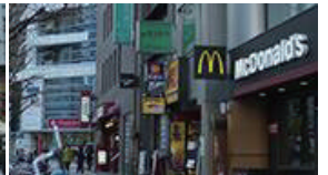
マクドナルド、ペローチェ、ファミリーマートが見えてきます。