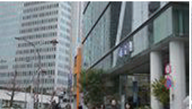
河合塾が見えてきます。