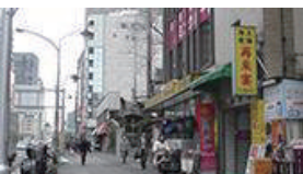
「再来宴」という中華料理屋さんの看板が見えます。