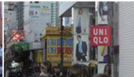
ユニクロ、金券チケット店を右手に直進します。