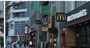
マクドナルド、ペローチェ、ファミリーマートが見えてきます。