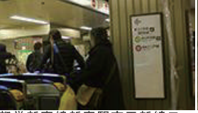
都営新宿線新宿駅京王新線口改札を出ます。