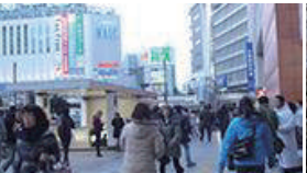
地上出口に向かって右方向に約200m道なりに進みます。