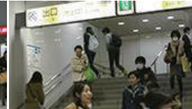
階段を上り、「出口」と書かれた方向へ上ります。