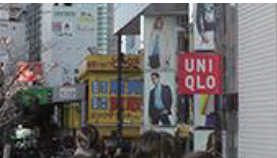
ユニクロ、金券チケット店を右手に直進します。