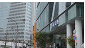
河合塾が見えてきます。