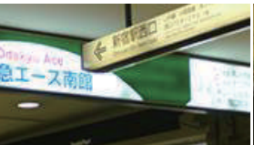
途中、新宿駅西口の方角を示す看板がありますので、そちらの方角へそのまま直進します。