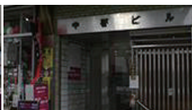
一つ先に1Fが作業着が入ったビルの5Fになります。