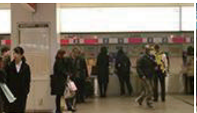
京王線のりばに入ると切符売り場が見えてきます。