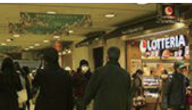
そのまま進んでいくと右手にロッテリアが見えてきます。