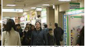
ショッピングモールを直進します。