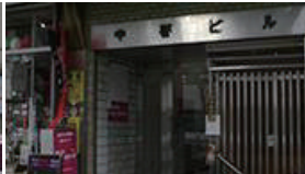
一つ先に1Fが作業着が入ったビルの5Fになります。